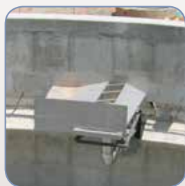
Scum Box (OPZIONE)